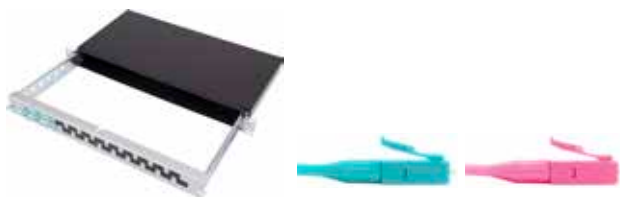
Vorkonfektionierter Patch-KEV LC/PC

Patch-/Patch-Panel für Breakout-/Fanout-Kabel mit Panel Auszug Alu schwarz / 2 Einführungen mit Brücken inkl. je 1x Blindplatte und Bürstenleiste / Inkl. Beschriftungsleiste und Montagematerial OMx = OM3 oder OM4