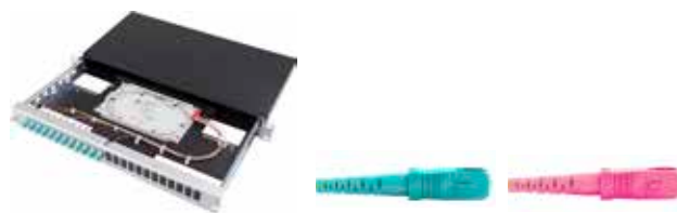
Vorkonfektionierter Spleiss-KEV SC/PC

Spleiss-/Patch-Panel mit Spleisskassettenhalter ausziehbar inkl. Spleisskassetten, ANT/SMOUV Halter und Spleisssschutze Alu Schwarz / 2 Einführungen mit Brücken inkl. je 1x Blindplatte und Bürstenleiste Inkl. Beschriftungsleiste und Montagematerial OMx = OM3 oder OM4