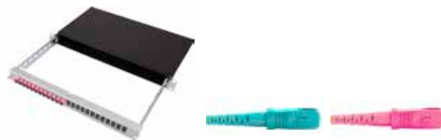
Vorkonfektionierter Patch-KEV SC/PC

Patch-/Patch-Panel für Breakout-/Fanout-Kabel mit Panel Auszug Alu schwarz / 2 Einführungen mit Brücken inkl. je 1x Blindplatte und Bürstenleiste / Inkl. Beschriftungsleiste und Montagematerial OMx = OM3 oder OM4