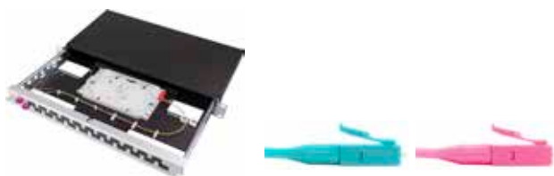
Vorkonfektionierter Spleiss-KEV LC/PC

Spleiss-/Patch-Panel mit Spleisskassettenhalter ausziehbar inkl. Spleisskassetten, ANT/SMOUV Halter und Spleisssschutze Alu Schwarz / 2 Einführungen mit Brücken inkl. je 1x Blindplatte und Bürstenleiste Inkl. Beschriftungsleiste und Montagematerial OMx = OM3 oder OM4